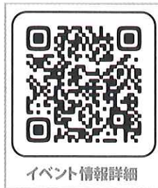
イベント情報詳細