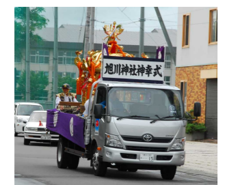
神様を奉載した大神輿

乗り入れ可能な車両 緊急自動車・路線バス・観光バス・大型トレーラー・大型トラック