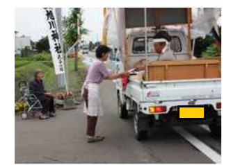
御神輿行列を出迎え、お供えされる様子